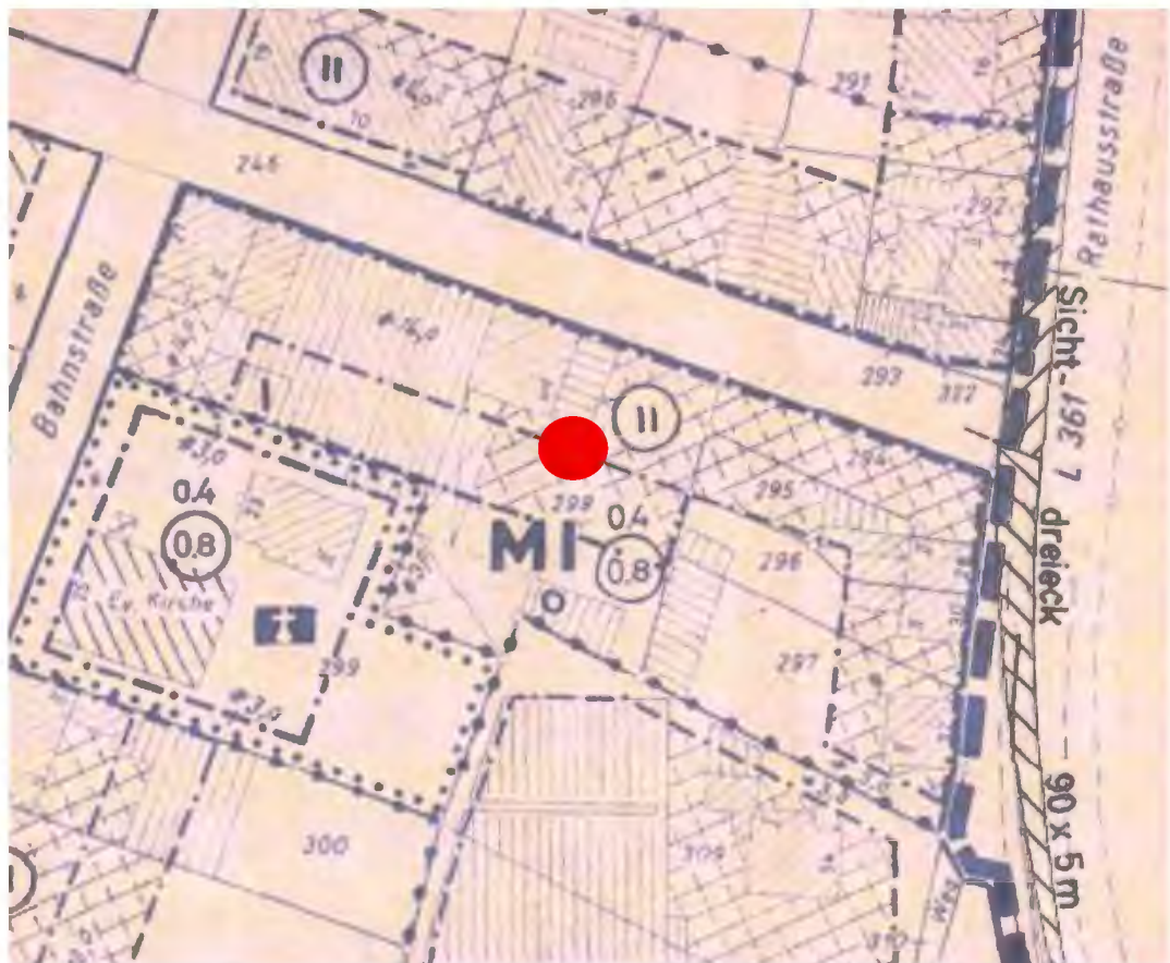
Bild 4: Ausschnitt aus dem Bebauungsplan Nr. 18 „Gartenstraße“ (unmaßstäblich), das Plangebiet ist mit einem roten Punkt markiert

Zur Schaffung der planungsrechtlichen Voraussetzungen für die beabsichtigte Erweiterung ist ein neuer Bebauungsplan erforderlich.