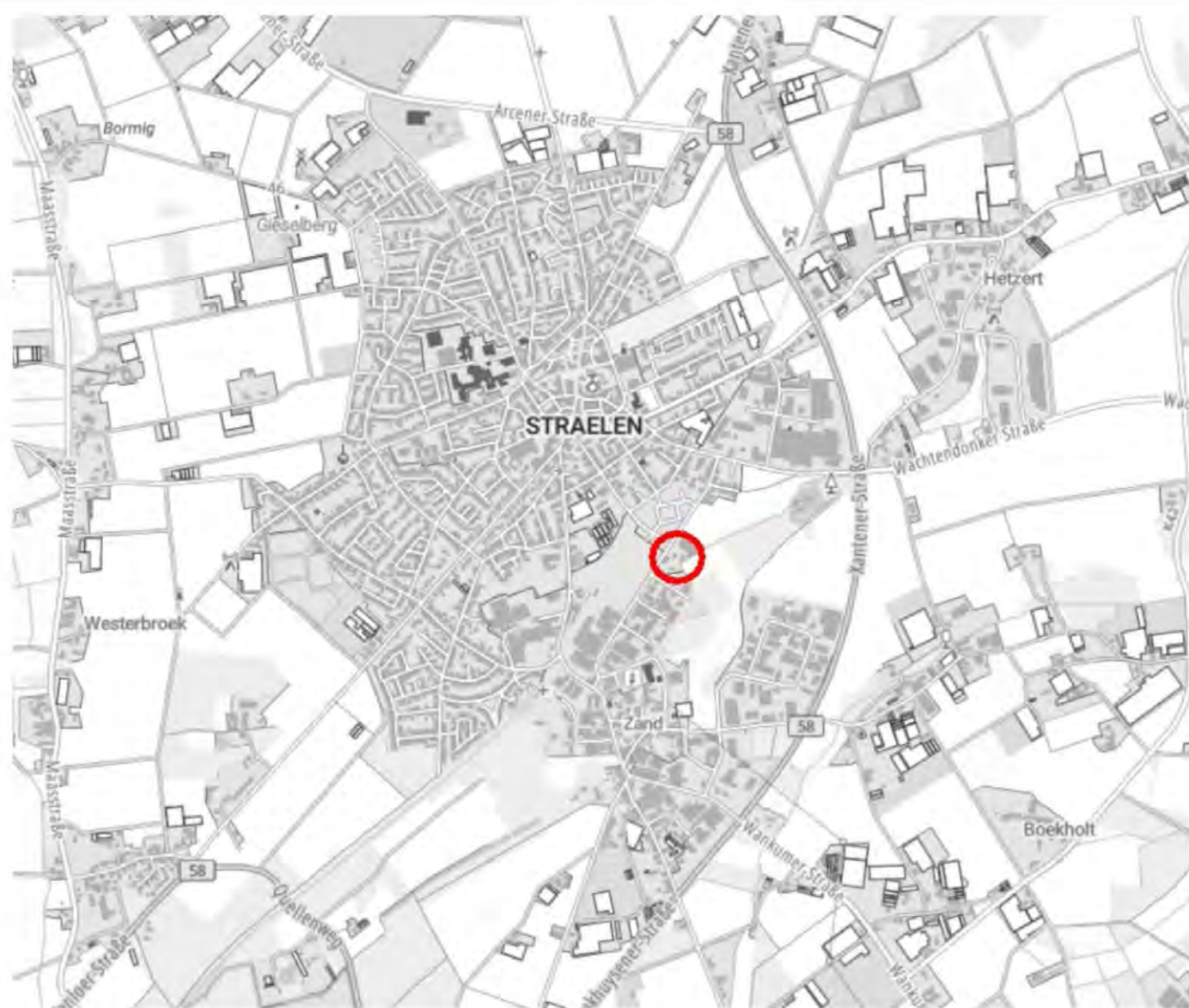
Lage des Plangebietes im Raum (ohne Maßstab)