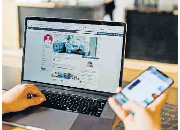
In der virtuellen Welt überzeugen: Stellensuchende sollten ihre Onlineprofile regelmäßig überprüfen und stets aktuell halten.

Doch auch hier sollten Bewerber seriös auftreten. Bilder, Beiträge, Kommentare und alles, was dem eigenen Ruf schaden könnte, sollte man tunlichst löschen - selbst wenn es sich buchstäblich um Jugendsünden handelt. Auf Facebook zum Beispiel kann man einschränken, wer einen auf Fotos markieren darf. Dadurch lassen sich unangenehme Überraschungen vermeiden. Unter adeccogroup.de etwa gibt es viele weitere Tipps für das digitale Eigenmarketing und die Jobsuche. Noch ein Tipp, der auf alle sozialen Plattformen zutrifft: Ein systematisches Aufräumen der eigenen Kontaktliste schafft Klarheit und sorgt dafür, dass man selbst relevantere Beiträge angezeigt bekommt. (djd)