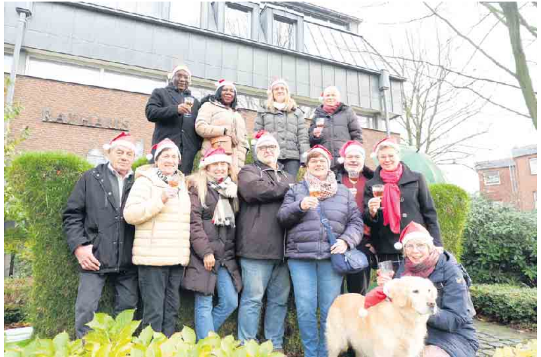
Der neue Vorstand und Vereinsmitglieder vor der grünen Couch