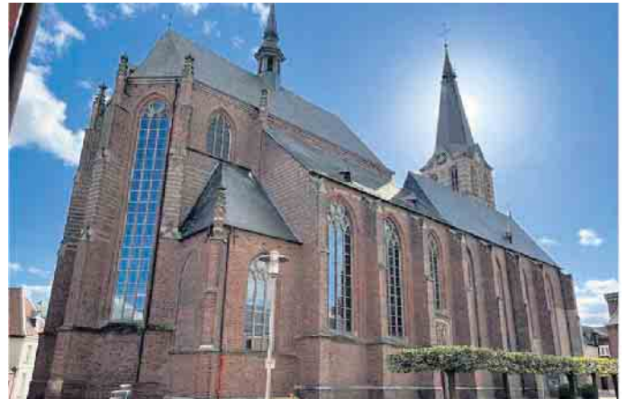
Katholische Kirche Straelen

10.45 Uhr - Hl. Messe mit Kinderkirche und Kindersegnung in SPP Hand in Hand - praktische Hilfen