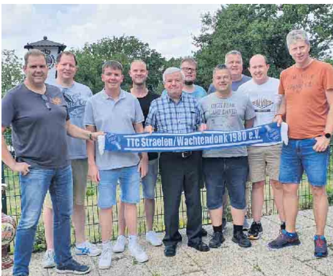
Der TTC-Vorstand. Erfolg schweißt zusammen.

Von allein kommt nichts, am besten fängt man früh an. Beim Tischtennis-Club Straelen/Wachtendonk 1980 e.V. wurde von der Gründung an die Ausbildung der Jugend nicht auf Tischtennis beschränkt. Es gehörte vielmehr zur Vereinsphilosophie das Prinzip: Wenn wir unseren Sportverein dauerhaft etablieren wollen, dann müssen wir auch Nachwuchs für unsere Ämter und Aufgaben im Verein ausbilden.