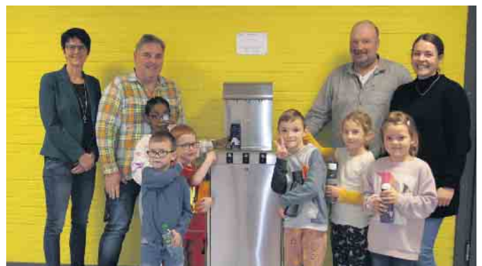
Der neue Wasserspender kommt sehr gut an!

nutzt und sehr gut von den Schülerinnen und Schülern angenommen wird.