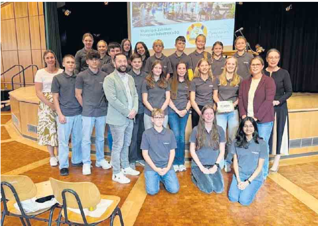
The Honeybee Industries eSG

Nur wenige Tage später folgte die nächste große Freude: In Oberhausen erhielten die „Honeybees“ gemeinsam mit sieben weiteren Schülergenossenschaften aus NRW eine Urkunde und Plakette für ihre nachhaltigen Geschäftsmodelle. Damit würdigte