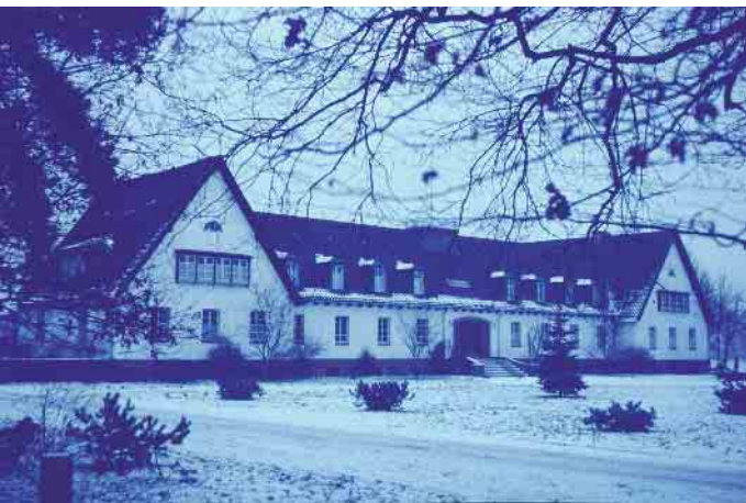
F3-0208