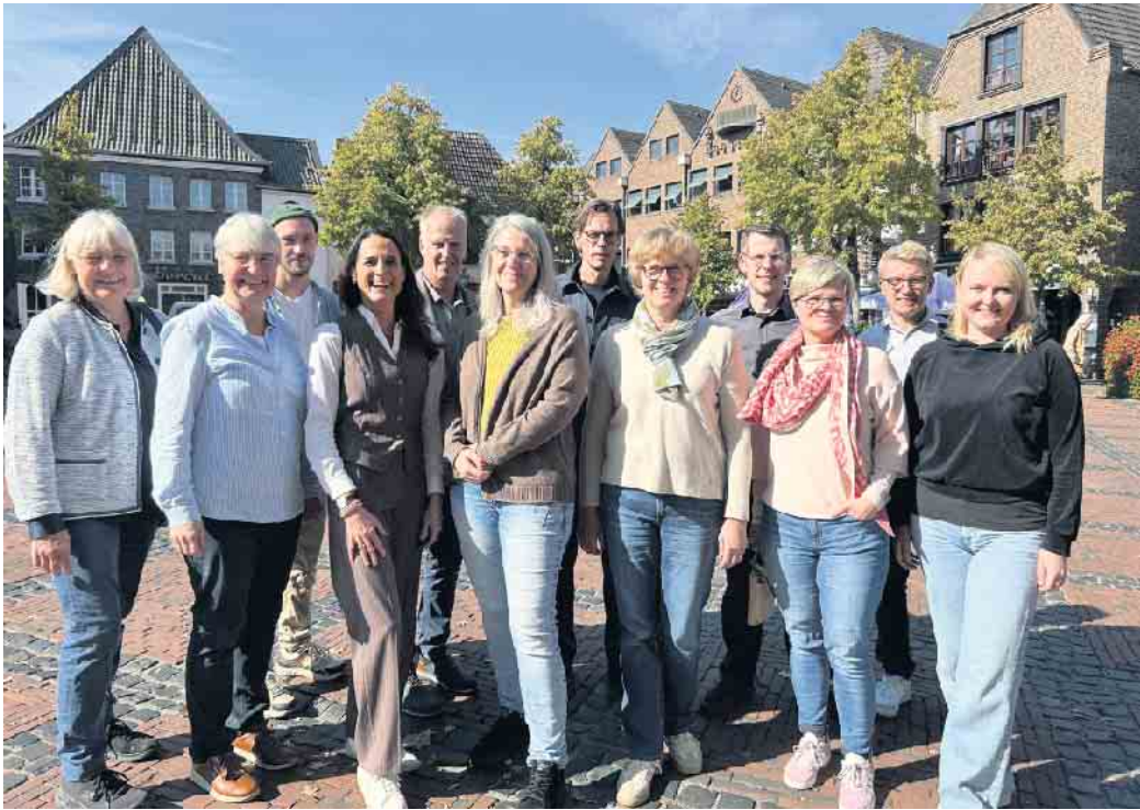
Die Projektgruppe Innenstadt

Zweimal hat sich die Gruppe bereits getroffen. Beim ersten Treffen stand der offene Ideenaustausch im Mittelpunkt. Gemeinsam wurde überlegt, wie leerstehende Räume in der Innenstadt kreativ und sinnvoll genutzt werden können. Eingeladen waren Vertreterinnen und Vertreter sozialer und kirchlicher Einrichtungen,