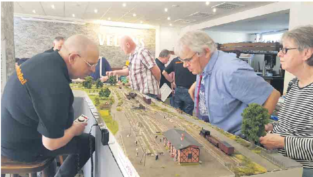
Das Modellbauteam Rhein-Maas e.V. ist auch wieder mit einem neuen Teil der Geldernsche Kreisbahn dabei (Foto von 2024, Bahnhof Kempen).

Am Sonntag, 12. Oktober, zeigen die Modellbahner vom Stammtisch Niederrhein (MSN) wieder unterschiedlichste Modellbahnanlagen, Dioramen und Züge in verschiedene Größen. Dazu erwartet die Besucher ein Rangierspiel und auch der Lokdoktor wartet auf neue Patienten. Aber auch Feuerwehr-Fahrzeuge und BookNooks (Mini-Häuschen fürs Bücherregal) werden gezeigt. Beim Suchspiel können die Kinder sogar noch etwas gewinnen. Der Eintritt ist frei. Also ein lohnendes Ausflugsziel für den Sonntagsausflug. Gegründet wurde der Stammtisch 2019. Mittlerweile haben sich viele Teilnehmer aus der ganzen Region eingefunden. Der Austausch und die Gemütlichkeit stehen im Vordergrund. Aber auch die Gegenseitige Hilfe beim Bau der Heimanlage oder die Reparatur defekter Modelle sind Themen beim Stammtisch. Also einfach mal vorbeischaun und etwas zum Zeigen oder ausprobieren mitbringen. Die Modellbahner treffen sich jeden ersten Donnerstag im Mo-