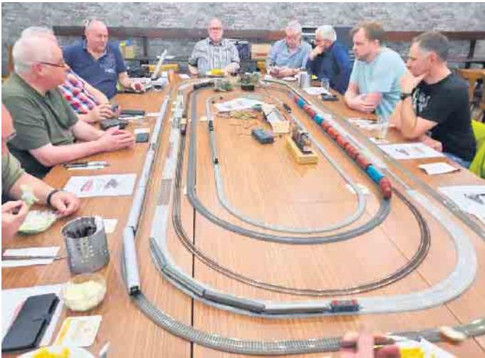
Beim regulären Stammtisch sind viele Systeme vertreten und jeder ist ohne Anmeldung willkommen.