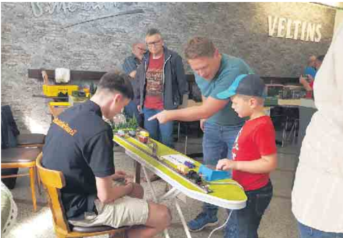
Beim Rangierspiel können Groß und Klein ein Rangierdiplom verdienen.

nat in der Gaststätte Alt Veert, Veerter Dorfstr. 22, 47608 Geldern-Veert. Auch an diese Abende sind Interessierte ab 19 Uhr immer willkommen. Der Spiel- und Showtag findet am 12. Oktober, in der Gaststätte Alt Veert, von 11 bis 17 Uhr, statt. Der Eintritt ist frei. Text: MSN