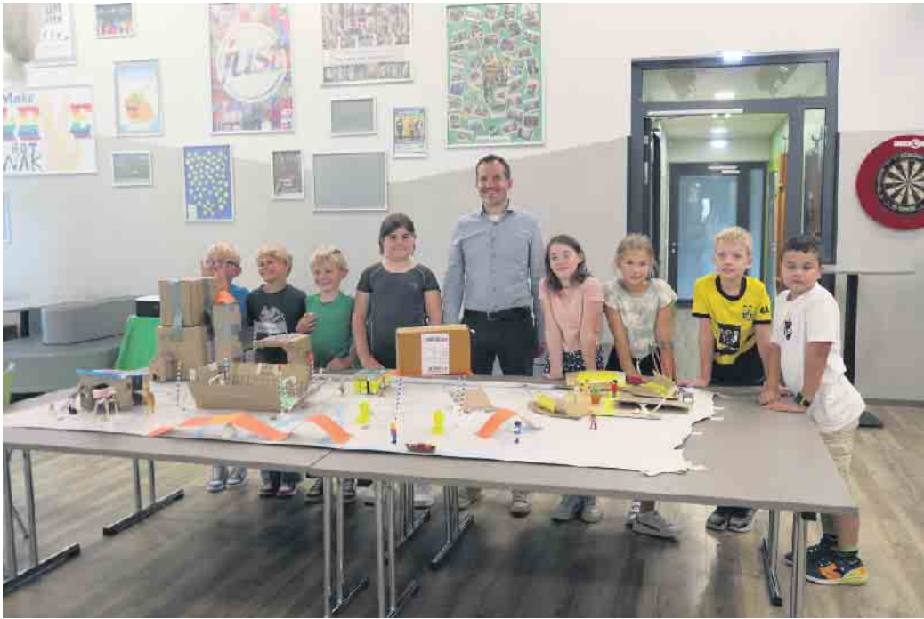
Bürgermeister Bernd Kuse war begeistert von den vielen kreativen Ideen der Kinder.

Zwei Tage lang drehte sich im Jugendzentrum Straelen (JuSt) alles um die Wünsche und Ideen der jüngsten Bürgerinnen und Bürger. Im Rahmen des Projekts „Wünschekommune: Kinder entdecken ihre Kommune“, das in Zusammenarbeit mit dem Kreis Kleve sowie dem Diskurs Niederrhein stattfand und vom Ministerium für Kinder, Jugend, Familie, Gleichstellung, Flucht und Integration des Landes Nordrhein-Westfalen finanziert wird, erforschten Kinder aktiv ihre Stadt Straelen und entwickelten anschließend ihre eigene „Wünschestadt Straelen“. Im Fokus des Projekts standen die Themen Kinderrechte und Demokratie, die die Kinder während der gesamten Veranstaltung begleiteten und in ihre Ideen einfließen ließen. Die jungen Teilnehmerinnen und Teilnehmer entwarfen eine fantasievolle Stadt, die ihre Vorstellungen und Bedürfnisse widerspiegelt. Besonderer Höhepunkt war der Besuch von Bürgermeister Bernd Kuse: „Sehr interessant, unsere Stadt aus der Perspektive der Kinder zu sehen. Danke an das Team und vor allem