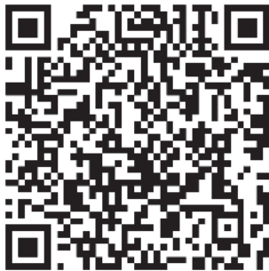
QR-Code Offenlage des Einzelhandelskonzepts

Uhr, mittwochs von 8.30 Uhr bis 12.30 Uhr, donnerstags von 8.30 Uhr bis 12.30 Uhr und von 14.00 Uhr bis 18.00 Uhr und freitags von 8.30 Uhr bis 12.30 Uhr. Stellungnahmen zum Fortschreibungstext können während der oben genannten Veröffentlichungsfrist per Mail an wfg@straelen.de oder an Madlen Fünfgeld von Stadt + Handel ( fuenfgeld@stadt-handel.de ) gesendet werden. Für Fragen steht Uwe Bons unter Telefon 02834 / 702-210 oder uwe_bons@straelen.de zur Verfügung.