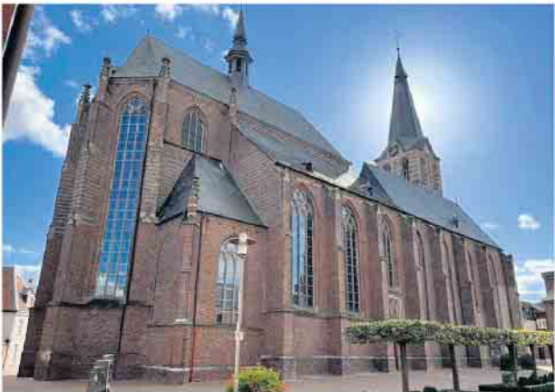
Katholische Kirche Straelen

Am 4. September findet von 19 bis 21 Uhr unsere Gemeindeversammlung im Gemeindehaus am Kirchplatz statt. Dazu lädt der Pfar-