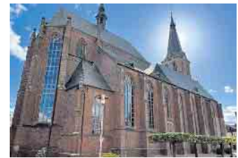
Katholische Kirche Straelen