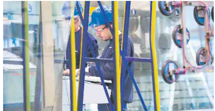
In der Flachglasbranche gibt es spannende Ausbildungsmöglichkeiten.

und Tipps rund um die beliebtesten Berufe der Branche. Ganz gleich ob Ausbildung, Praktikum oder Studium, auf ZIG geht es mit wenigen Klicks zum Traumjob“.