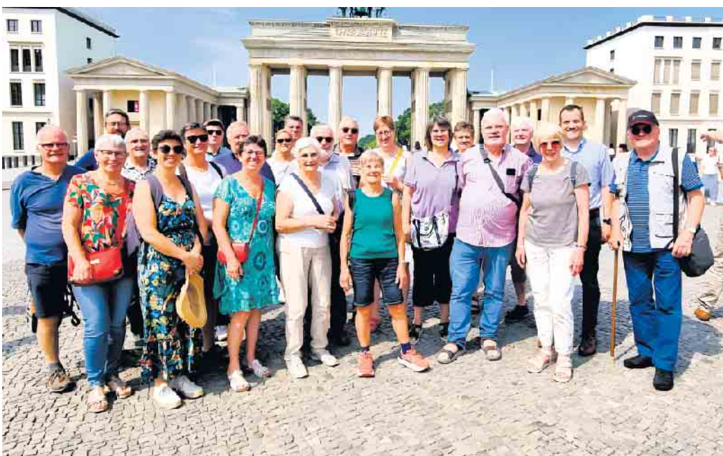
Bayoner und Straelener Teilnehmer gemeinsam vor dem Brandenburger Tor