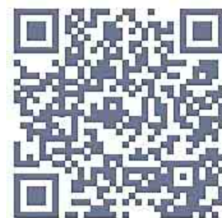
QR-Code zur Anmeldung im Wasserwerk

Auch für das leibliche Wohl wird gesorgt sein und die Kinder können sich über die Couch-Hüpfburg sowie über Spiel- und Bastelmöglichkeiten vor dem Rathaus freuen. Aber nicht nur im und vor dem Rathaus ist jede Menge los. Besuchen Sie auch das Stadtarchiv auf der Kuhstraße 21 und den Baubetriebshof auf der Von-Siemens-Straße in der Zeit von 10 bis 16 Uhr. Das Team vom Baubetriebshof hat sich jede Menge ausgedacht und zeigt die große Bandbreite der unterschiedlichen Arbeitsgeräte und -maschinen. Nicht nur für die Kleinen eine tolle Gelegenheit und bestimmt ein Riesenspaß. Für Erfrischungen wird auch hier gesorgt. Mit einem Besuch im Wasserwerk in Kastanienburg, in der Dammerbrucher Straße 25 erwartet Sie noch ein besonderes Highlight. Aus Si-