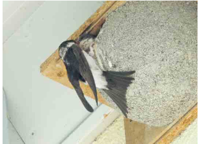
Mehlschwalbe füttert am Nest.

In Nordrhein-Westfalen gibt es immer weniger Schwalben. Mit der Aktion „Schwalbenfreundliches Haus“ will der Naturschutzbund Deutschland (NABU) diesem Trend entgegenwirken und zeichnet auch 2023 wieder Menschen und Häuser aus, bei und an denen die Glücksbringer willkommen sind.