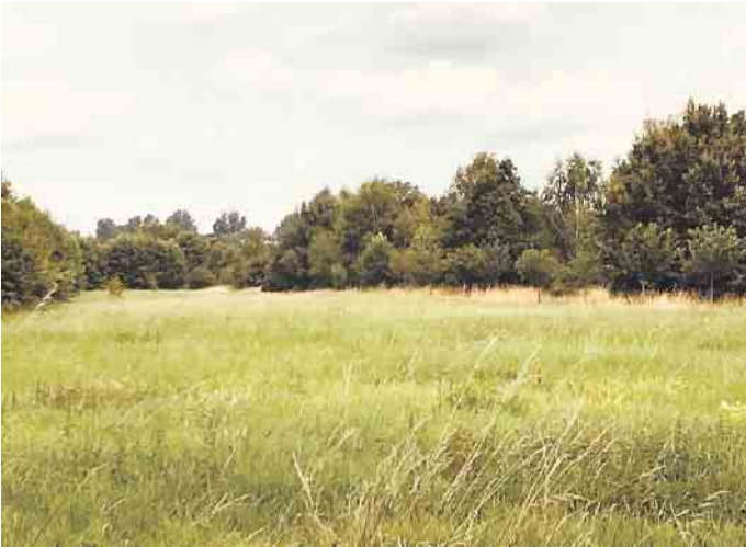
Naturnahes Feuchtgrünland am Landwehrbach in Schaephuysen.

Hausbesitzer können sich und ihr Heim auszeichnen lassen