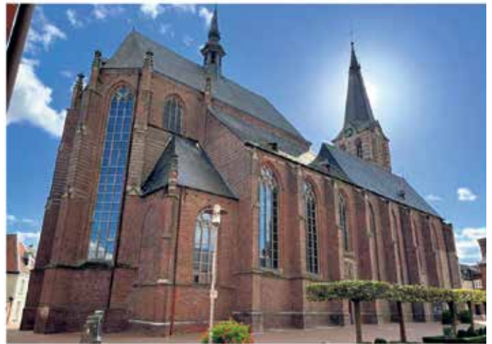
Katholische Kirche Straelen

Öffnungszeiten: Di. 11 bis 12 Uhr, Do. 15 bis 17 Uhr, So. 10 bis 12 Uhr Weitere Infos auch auf unserer Homepage kirche-straelen.info oder bei Facebook: „Pfarreirat Straelen“ und „Gemeinde St. Peter und Paul Straelen, Instagram: st.peter.und.paul.straelen