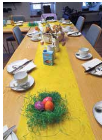
Ein liebevoll gedeckter Frühstückstisch wartet auf die Archivfreunde.

Bei einem leckeren Frühstück kam es zu vielen interessanten und anregenden Gesprächen.