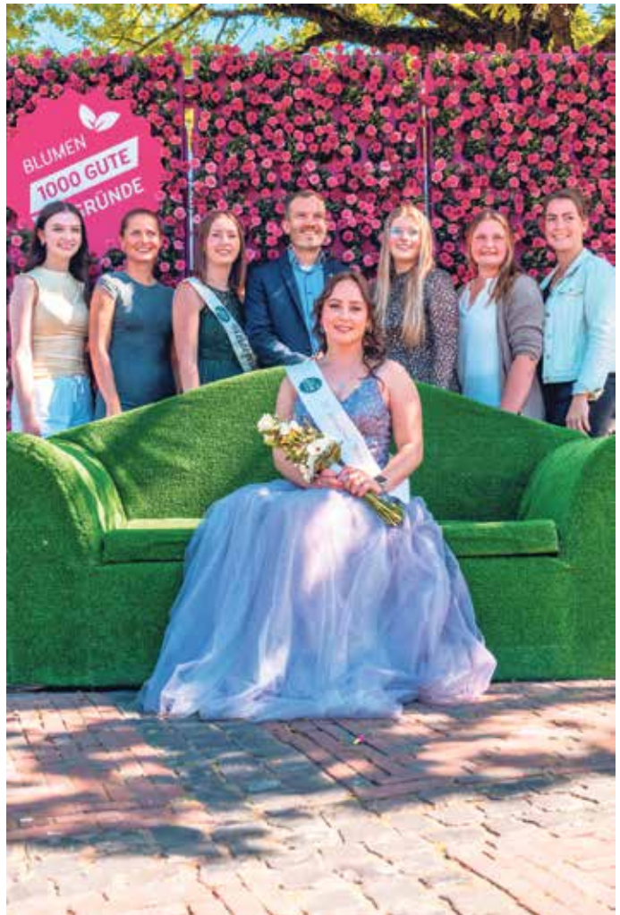
Der Frühlingsblumenmarkt 2025.

Ein ganz besonderer Moment erwartet die Besucher um 12.00 Uhr: Dann findet die offizielle Vorstellung des neuen Straelener Blumenmädchens statt. Mit diesem feierlichen Akt tritt das 14. Straelener Blumenmädchen offiziell ihr Amt an und wird künftig die Blumen- und Gemüsestadt Straelen bei zahlreichen Anlässen repräsentieren.