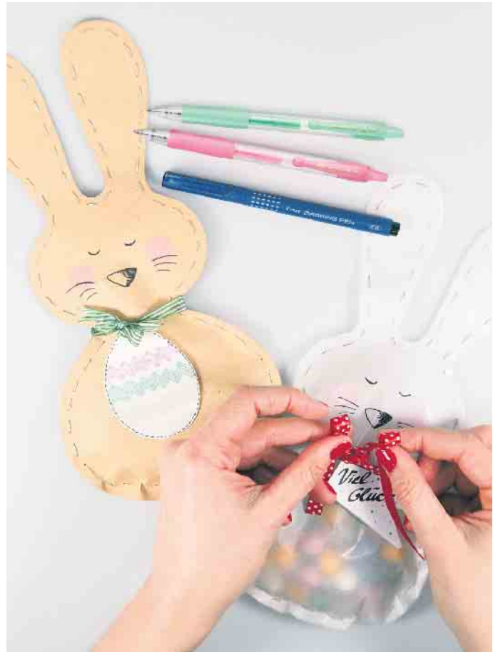
Ob für die Eiersuche oder als süße Geschenkverpackung: Über die Osterhasentüten freuen sich Jung und Alt.

Für den Anhänger die ausgedruckte Ostereivorlage oder eine selbst gewählte Form aus Papier ausschneiden und mit verschiedenfarbigen G2-7 Stiften indi-