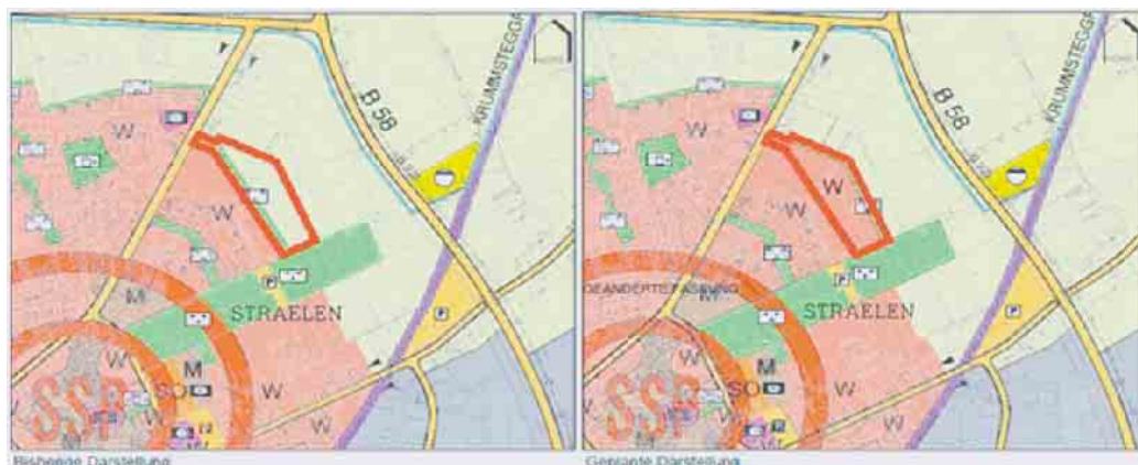
Die rote Linie umrandet und zeigt das Plangebiet.