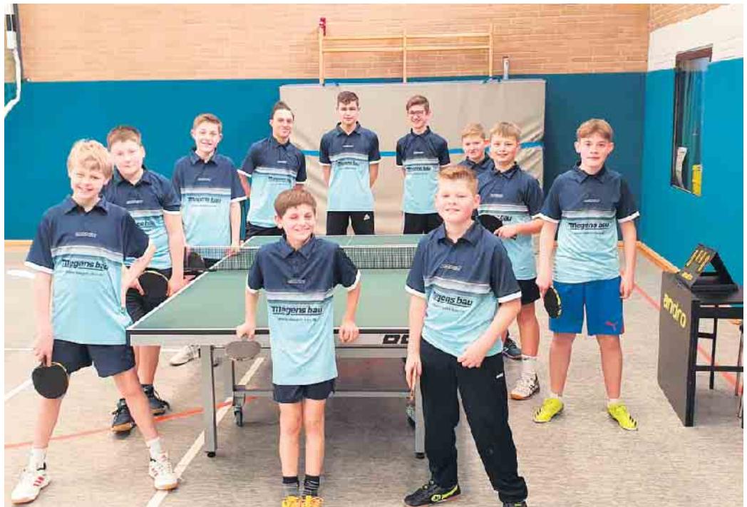
Drei Mannschaften des TTC machten den Auftakt für mehrere „Spieltagevents“