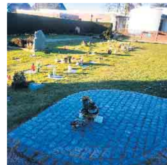
Fläche, auf der sehr gerne Grabschmuck abgelegt werden kann.

mit dem Rasenschnitt und der Pflege der Grünanlagen beginnen. Dies ist nur möglich, wenn die Flächen entsprechend frei bleiben.