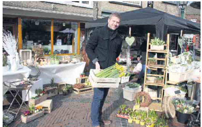
Blumen und Dekorationsartikel in der Straelener Innenstadt

te Mischung aus Ständen mit frühlingshaften Artikeln, gastronomischen Angeboten und frischen Blumen, welche zum Bummeln und Stöbern in der Straelener Innenstadt einladen. Darüber hinaus öffnen die Einzelhandelsgeschäfte von 13 bis 18 Uhr ihre Pforten zum verkaufsoffenen Sonntag, um die Kunden mit besonderen frühlingshaften Angeboten und Rabatten auf die neue Jahreszeit einzustimmen. Für die passenden Frühlingserwachen-Gefühle sorgt ein leises „Vogelgezwitscher“, welches den Bummel durch die Innenstadt akustisch untermalt. Als musikalisches Highlight, wird eine niederländische „Joekskepel“ für