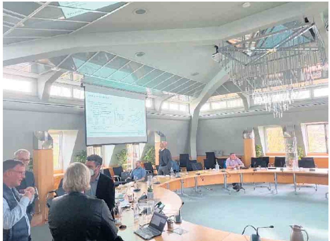
Projektpartnerworkshop in Straelen.

Auf dieser Basis konnte das Team des Fraunhofer IEG die geologischen Bedingungen unter Straelen gut abschätzen und auch die zu erwartenden thermischen Erträge möglicher