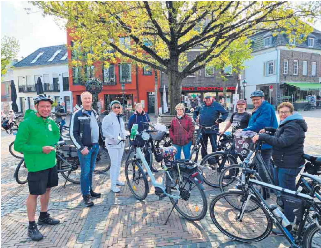
Los geht es am Marktplatz.

Geführte Radtouren in und um Straelen erfreuen sich großer Beliebtheit