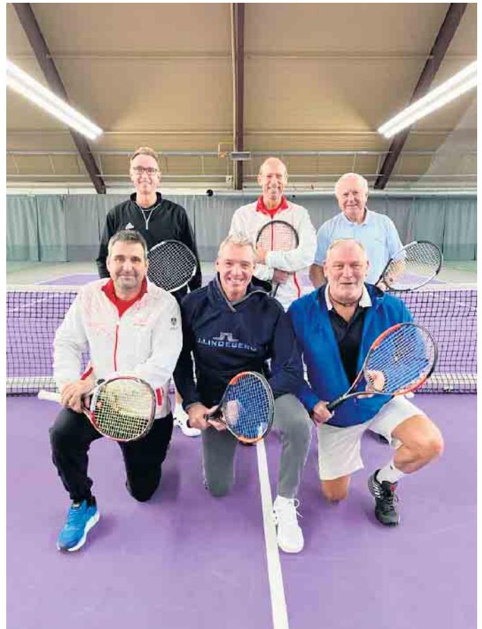
Die erste Herrenmannschaft