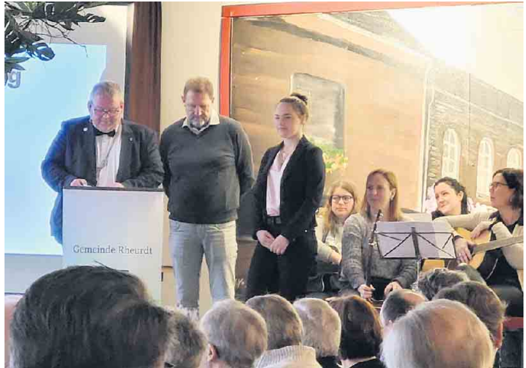
Sportlerehrung Gemeinde Rheurdt

Für dieses Jahr streben beide Fahrsportler sicherlich weitere Erfolge an. Selbstverständlich immer unter der Prämisse, dass es allen Beteiligten wie Fahrer und Huftieren gut geht und sie trainiert in die neue Saison starten können. Ein Highlight in diesem Jahr ist sicherlich die Rhein-