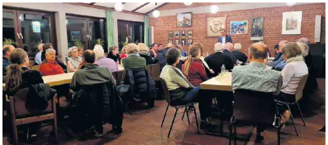
Schöner Austausch beim Heronger Treff

gung zum Thema Dorferneuerung einladen, die am 10. Mai im Pfarrzentrum stattfinden wird. Im Mittelpunkt werden der Marktplatz und der Dorfweiher stehen. Wir sind gespannt auf Ihre Ideen und Anregungen.“, so der Bürgermeister abschließend.