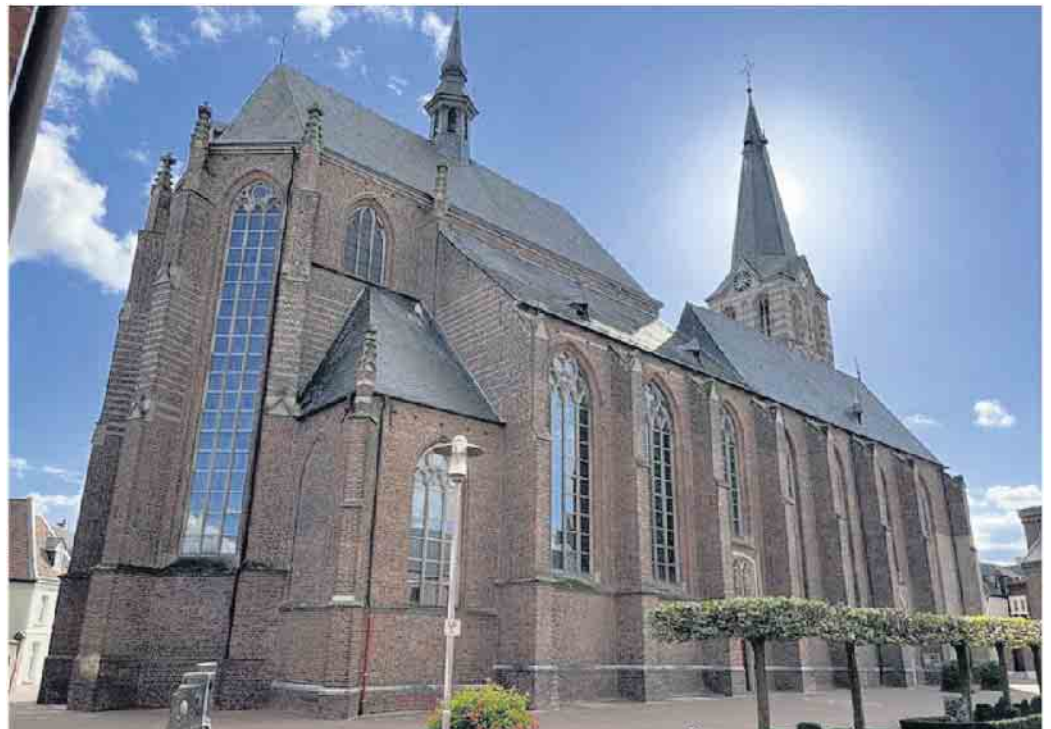
Katholische Kirche Straelen