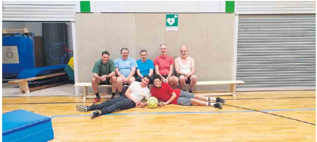
Die „Freitags-Fummler“ wünschen sich Verstärkung