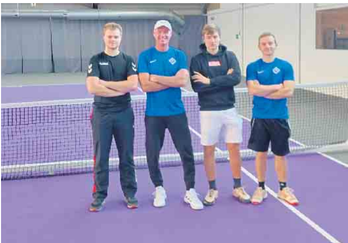
Die Herren 50

Goch (1.Herren) bzw. am 12. Februar zu Hause (Herren 50) gegen TC Sonsbeck statt. Unsere Damen 30 und D40 kämpfen bis zum Schluss um den Klassenerhalt. Hier finden die letzten Spiele am 4. März statt. Die zweite Herren 50 wollen am letzten Spieltag den Klassenerhalt klar machen (12. Februar). Alle Heimspiele finden in Nieukerk (Schuffis Fun Center) statt. Nur die Herren 60 spielen in der Wegmann Halle in Neukirchen.