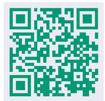
Anmeldung per QR-Code

Die Stadt Straelen bittet auch in diesem Jahr um eine Anmeldung. Neu ist die Möglichkeit, dass sich interessierte Bürgerinnen und Bürger schnell und problemlos über das neue Anmeldeportal auf der Internetseite anmelden können. Einfach dem Link im QR-Code folgen oder über den Link auf der Startseite www.straelen.de kostenlos die Tickets buchen. Eine telefonische Anmeldung ist im Büro des Bürgermeisters unter der Telefonnummer 02834 702 316 möglich.